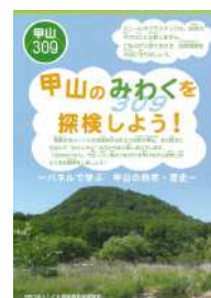
「甲山のみわくを探検しよう!」