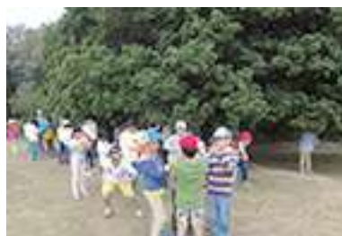
山頂での様子（ヤマモモの草笛に挑戦）