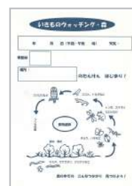
生きものウォッチング・森