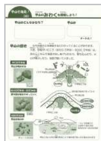
「甲山のみわくを 探検しよう!」