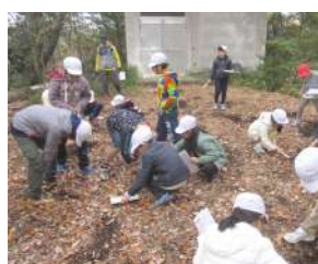
土を掘ってみよう!