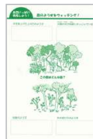
「森のようすを ウォッチング」