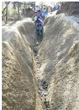
花崗岩（真砂土）の 斜面を歩く