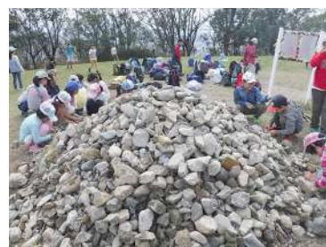
山頂での様子（石を観察する）