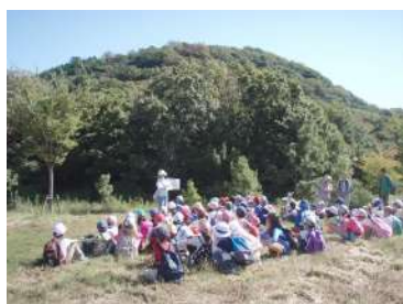
登山前に、お話「甲山の成り立ち」