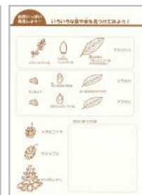
「いろいろな葉や実を 見つけてみよう!」