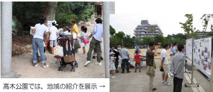
高木公園では、地域の紹介を展示 →

9月20日、「わがまち探検 親子でウォーキング」を行いました。高木公園をスタート、ゴールとし、熊野神社、日野神社、環境学習サポートセンターと地域をぐるっと一週り、普段は歩かない所を通り、まちの様子や自然をいろいろ発見しました。