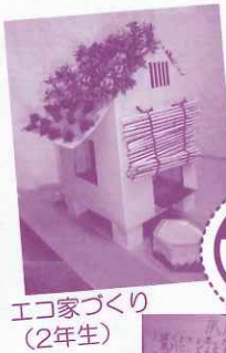
エコ家づくり (2年生)