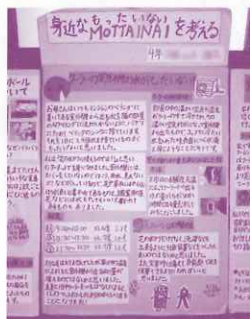
身近なMOTTAINAIを 考える (4年生)