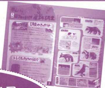
山田畑の動物 痕跡調査 (5年生)