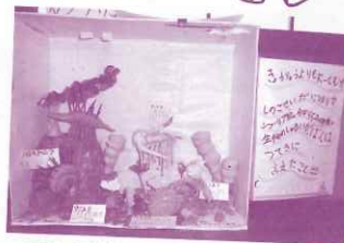
カンブリア水族館 (2年生)