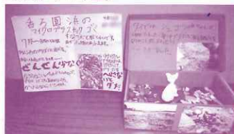
香る園浜のプラゴミとジュゴンの話 (4年生)