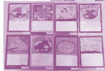
パキスタンの子どもたちの作品