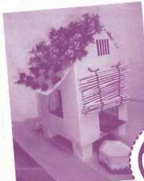
エコ家づくり (2年生)