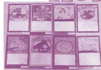
パキスタンの子どもたちの作品