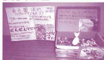
香る園浜のプラゴミとジュゴンの話 (4年生)