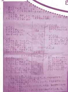
夙川の生き物調査 (3年生)