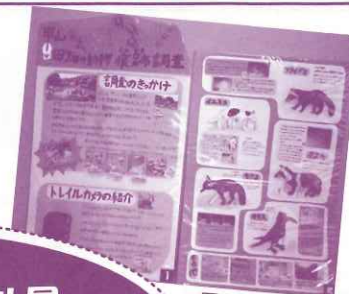
山田畑の動物 痕跡調査 (5年生)