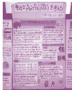
身近なMOTTAINAIを考える (4年生)

EWC環境パネル展は、毎年国内・海外から作品が寄せられ、今年で27回を迎えます。生き物や自然・資源・福祉・平和・身近なまちのことなどをテーマに約800点を展示。「へえ〜」「なるほど」…と様々な表現方法の作品は、夏休みの作品づくりの参考にもなりますよ! ぜひご来場ください。