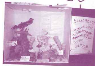
カンブリア水族館 (2年生)