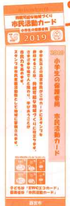
上部を切り離すとカードになります