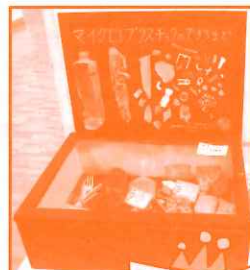
昨年度の受賞作品