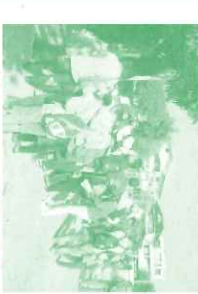
クイズポイントには西宮の歴史や地形がわかる場所でした。

11月5日、「にしのみやふるさとウォーク2016」が開催されました。今年甲山の東に位置する上ヶ原地域をめぐる能登運動場がゴール。家族・グループで環境、福祉、国際、地域の歴史文化等のクイズや展示を楽しみながら約8キロを歩きました。