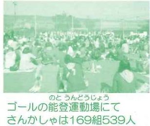
のとうんどうじょう ゴールの能登運動場にて さんかしゃは169組539人