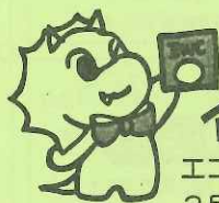
(2年生が書いてくれたかんそう)

「おもしろいね、はっぱをクワンでつかまえて、キャラメルのおいけしたよ。カツラの葉っぱもいっぱいひろいました。」 「おもしろいね、はっぱをクワンでつかまえて、キャラメルのおいけしたよ。カツラの葉っぱもいっぱいひろいました。」 「おもしろいね、はっぱをクワンでつかまえて、キャラメルのおいけしたよ。カツラの葉っぱもいっぱいひろいました。」