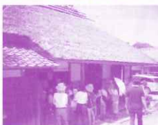
こみんか 古民家の見学