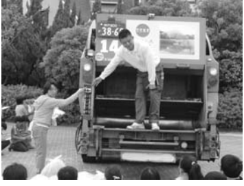
●段上西小学校4年生