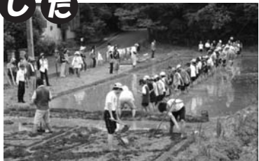
田植えの準備をするトライヤーの 中学生のお兄さんたち。

5月24日、5年生171名は甲山農地で田 植えや夏野菜の観察をしたほか、甲山自然 環境センターのまわりに残されている、大 阪城の石垣をつくるために切りだされた石 を探しました。田植えには、PTAのお母さんや甲陽園エココミュニティ会議 の人たちも参加してくださり、順番整理やみんなのドロドロになった足を洗う お手伝いをしてくださいました。お米ができるのが楽しみだね!