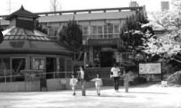
かぶとやま自然かんきょうセンター