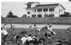
にしのみや市見るいかん

にのみやには、いろいろ しせつが あるよ！ しせつつの まわりで いきものを はっけんしよう！