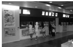
ミニミニすいぞくかん (かんきょう学習サポートセンター)