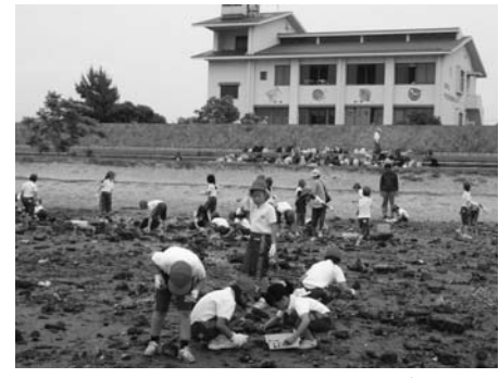
春風エココミュニティ会議の人が 活動をサポートしてくれました。

たばこのすいがら、ガラスやお茶わんのかけら、 ペットボトルのふた、紙きれなど、人間が捨てたも の、落とされたものがたくさん！ この「ごみ」によ って傷つくいきものがいることを学び、私たちがし なければならないことを考えました。