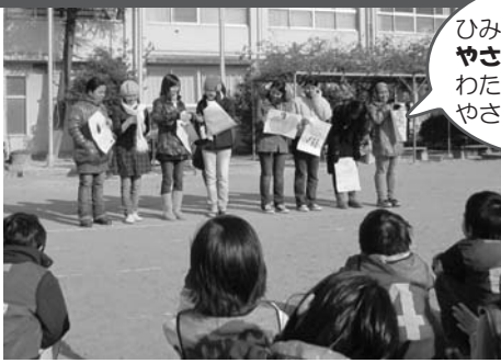
かみこうしえん 上甲子園小学校 2年生学年PTA

12月9日、お母さんといっしょに「ひみつのことばをさがせ」をしました。校庭にかくされた「もじ」をグループみんながきょうりよくして見つけました。西宮に勉強にきているアジアの留学生たちも参加しました。みんなと楽しく勉強ができたそうです。留学生の人たちは、国際交流デーで自分たちの国のことや活動をはっぴょうします。見に行ってくださいね!