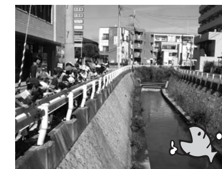
学校・地域・お家でエコスタンプをおしてもらおう！