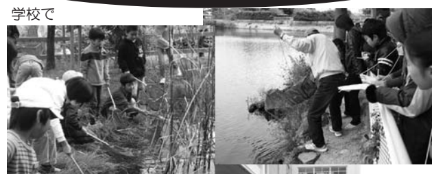
場所によって住んでいる生きものがちがうことがわかりました