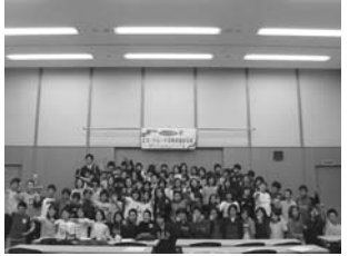
昨年度EWC・トレード活動資金授与式の様子

新しいエコカードが配られ、子どもたちは早速 学校や施設、お店など様々な場所でエコスタンプを押しもらっています。ぜひエコカードをご覧いただき、どんなところでエコスタンプを集めているのかなど、話題にされてはいかがでしょうか？また5・6年生では、EWCサブシステムとして、社会とのつながりを考える「エコ・トレード活動」があります。昨年度は16校44クラスが参加しました。これは身近なエコ活動が、経済的にも地球環境の保全につながることを、理解してもらう活動です。EWCでは、子どもたちの発達段階に応じて視野が広がる活動のしくみを取り入れています。