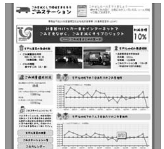
収集日の各ステーションの様子やごみ量を公開