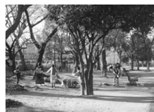
落ち葉の山ができました

＜活動内容＞ 小学校と連携しながら、毎年2回行われる地域主催の清掃活動「わがまちクリーン大作戦」に、多くの子どもたちの参加を呼びかける活動を行いました。チラシを通じて啓発しました。