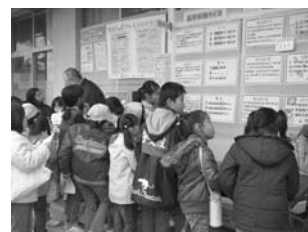
エコクイズ 全問正解できるかな？