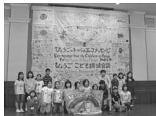
メッセージフラッグと一緒に