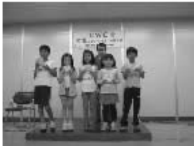
5月25日におこなわれた アースレンジャーファミリーひょうしょうしき

みんながアースレンジャーになり、 おうちの人 ほごしやう が保護者用カード (エコカードの はしについてるよ)に エコスタンプを15こあつめると アースレンジャーファミリーだ! 昨年度は122家族が アースレンジャーファミリーになったよ。