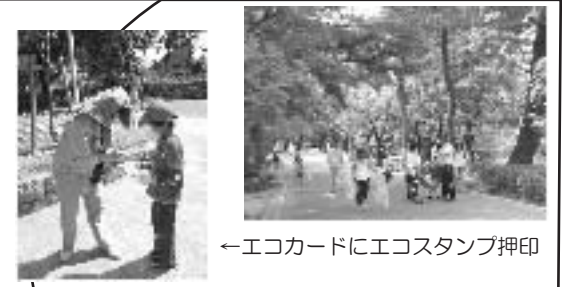
←エコカードにエコスタンプ押印